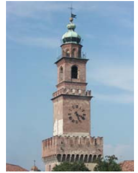
Torre del Castello, attribuita a Donato Bramante