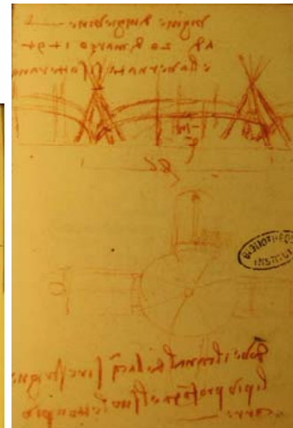
Vigne di Vigevine