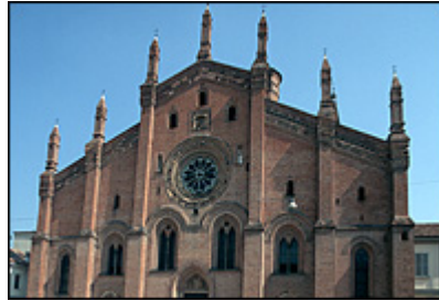
Santa Maria del Carmine