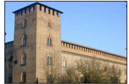
Castello Visconteo Sforzesco