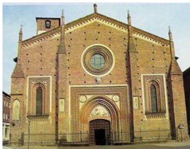
Basilica di San Lorenzo