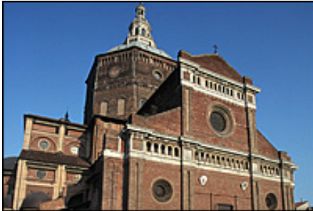
Duomo di Pavia