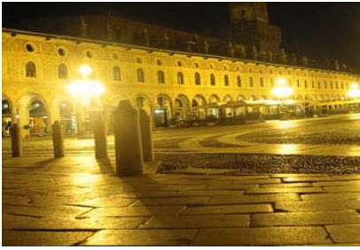
Piazza ducale o Piazza ludoviciana